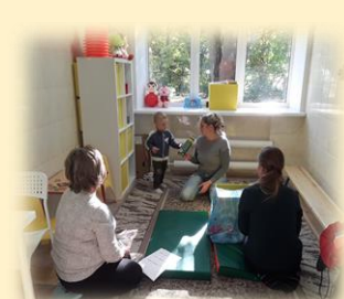
Алгоритм функционирования службы ранней помощи НП «Содействие»

С 2016 года организована работа собственной службы ранней помощи на основе договора о сотрудничестве с ГУЗ «Центр детской психоневрологии» и МБУ ДО «Центр психолого-педагогического и социального сопровождения». Ежегодно команда специалистов оказывает помощь более чем 20 семьям с детьми раннего возраста с различными нарушениями, отработывая современные эффективные подходы и технологии